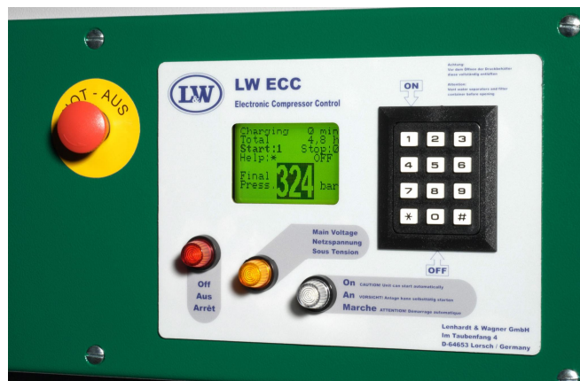
SYSTEM STEROWANIA ECC

SCANTEK Sp. z o.o. 80-246 Gdańsk ul. Pniewskiego 7/1