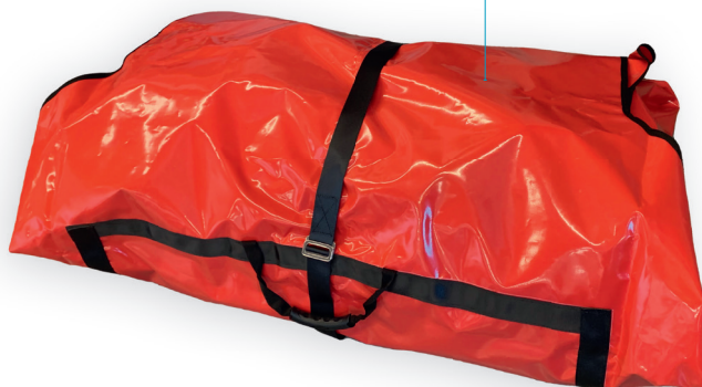
Torba transportowa w komplecie